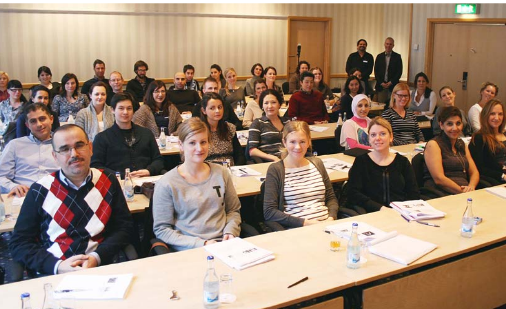
Föreläsning i anpassade och bekväma lokaler

Sveriges Tandläkarförbund har som ett av sina mål att kunna erbjuda majoriteten tandläkare och en stor del av tandvårdspersonalen utbildning av mycket god kvalitet. Alla i yrket ska ges möjligheten att upprätthålla och utveckla sin kompetens genom livslång och regelbunden efterutbildning. Efterutbildningen är ett steg på vägen till god och ständigt utvecklad vård.